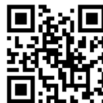
悠遊卡繳納學雜費優惠活動 QRcode