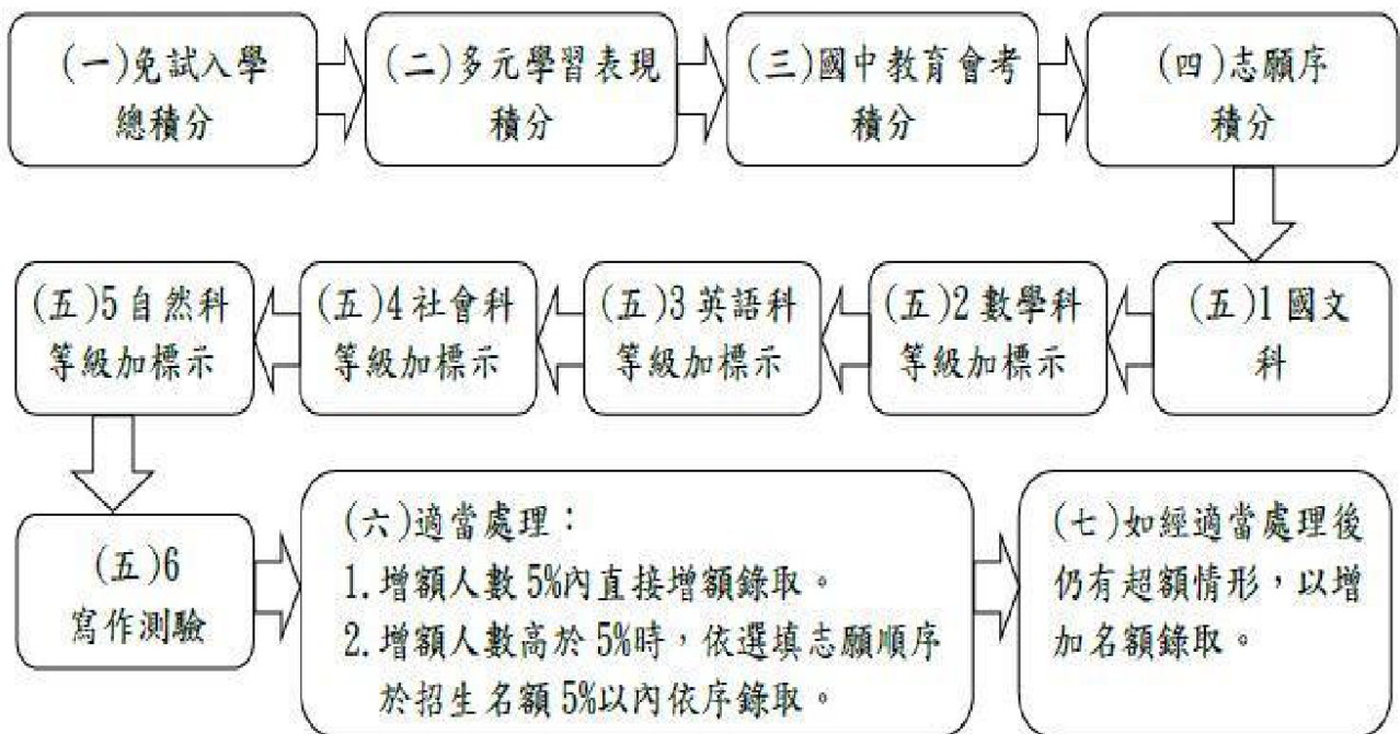
免試入學超額比序順次圖